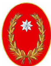
Provincia di Campobasso

Contributo di € 80.000 sul fondo di solidarietà per l'implementazione del progetto su tutto il territorio provinciale.